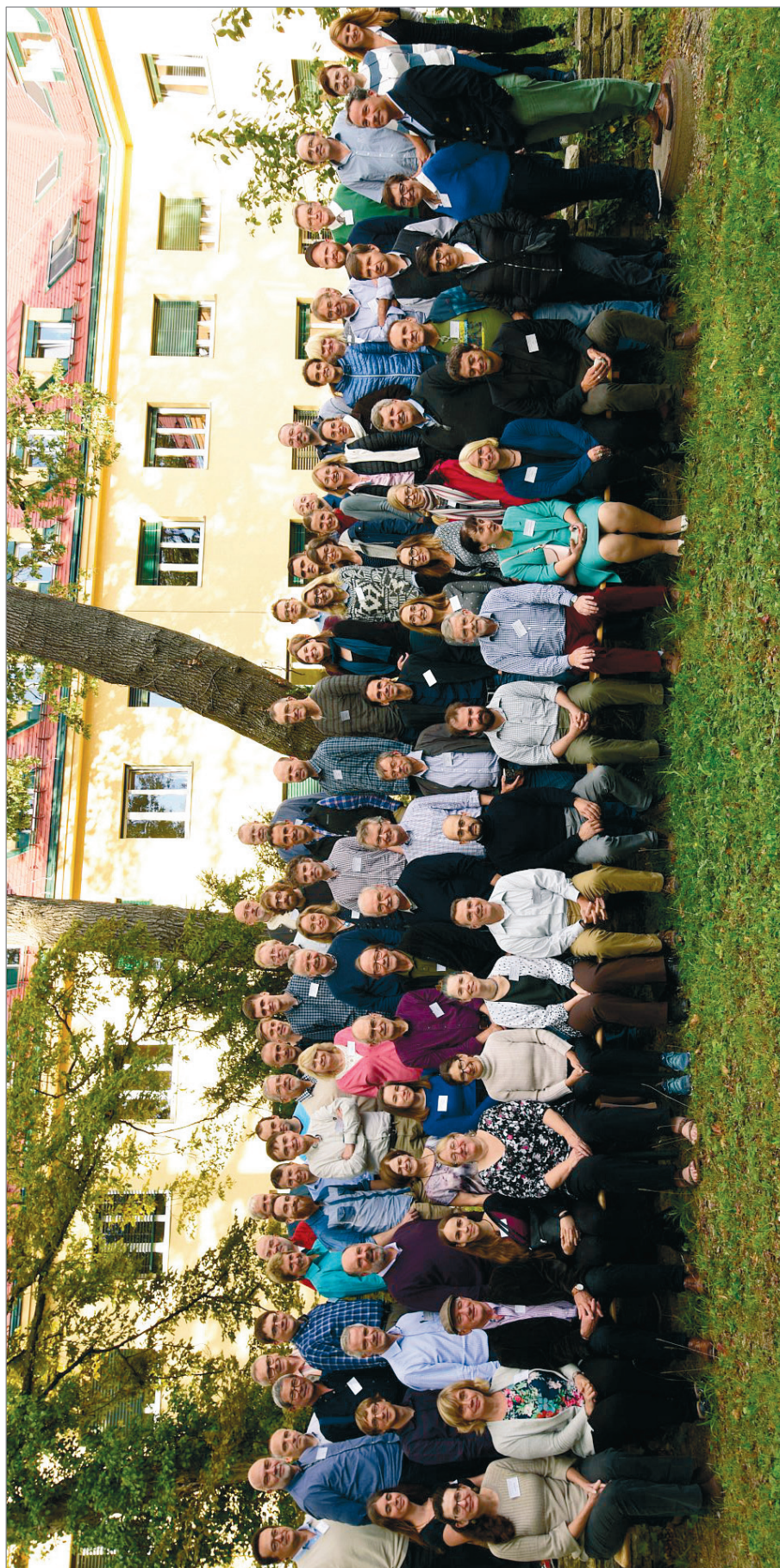
Рис. 1. Участники конференции на фоне здания Австрийского центра по изучению лесов (2 октября 2018 г.).