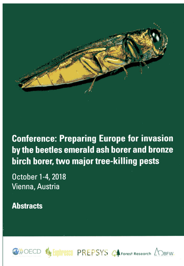
Рис. 2. Обложка сборника тезисов конференции. https://bfw.ac.at/cms_stamm/050/PDF/prepsys_abstracts.pdf

ствие ясеневой и березовой златок с новыми и аборигенными для них кормовыми растениями» (D. Herms, США).